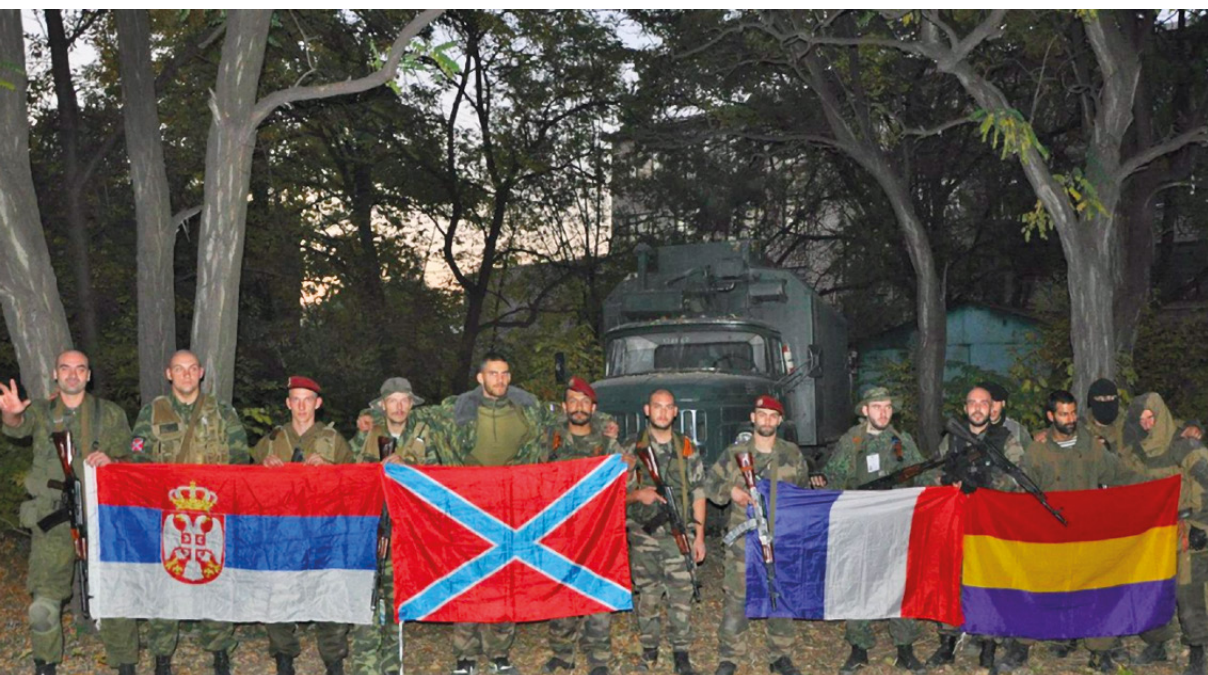
◀ Члены НВФ «Unité Continentale». Украина, октябрь 2014 года

На апрель 2017 года на сайте Единого государственного реестра судебных решений по ст. 447 УК Украины