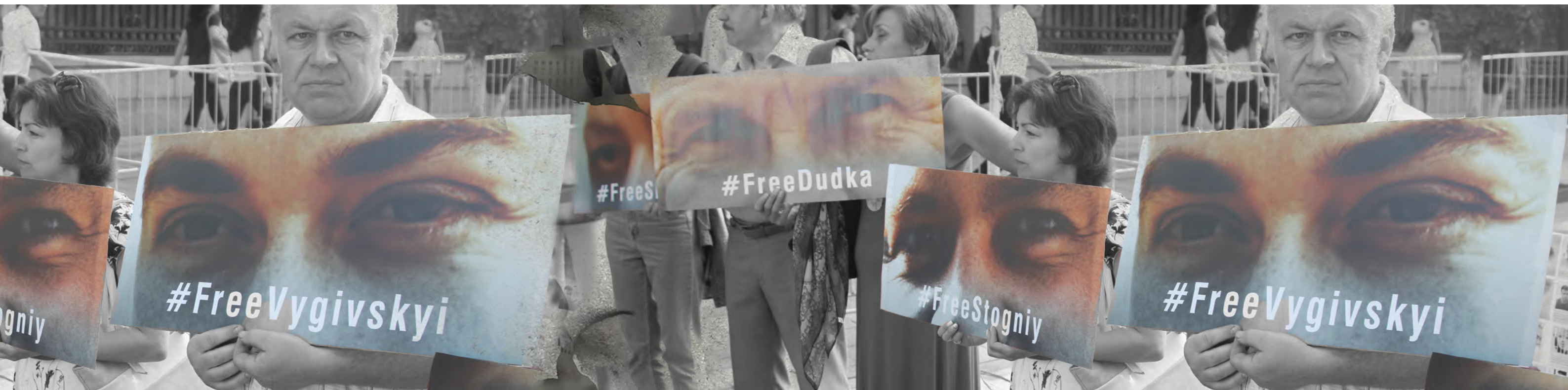
13 липня 2017 року. Київ. Акція неподалік Адміністрації Президента України, приурочена до 19-го саміту Україна-ЄС. Перша публічна акція, в якій взяли участь родини як військовополонених і цивільних заручників ОРДЛО, так і утримуваних в Криму та Росії з політичних мотивів громадян України.

Звіт підготований Медійною ініціативою за права людини (МІПЛ), Українською Гельсінською спілкою з прав людини (УГСПЛ) та Euromaidan Press (EP).