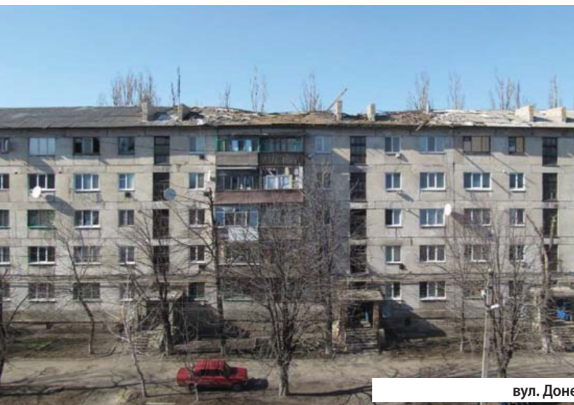
вул. Донецька, б. 1 Б

«Спочатку здавалося, що «сіра зона», в якій ми опинилися, нікому не потрібна. Зараз відчуваємо підтримку держави. Будинки відновили, у школах зробили ремонт. Таких ремонтів не було ні за часів СРСР, ні в період незалежної України. Вдалося залучити чимало міжнародних проектів». 17