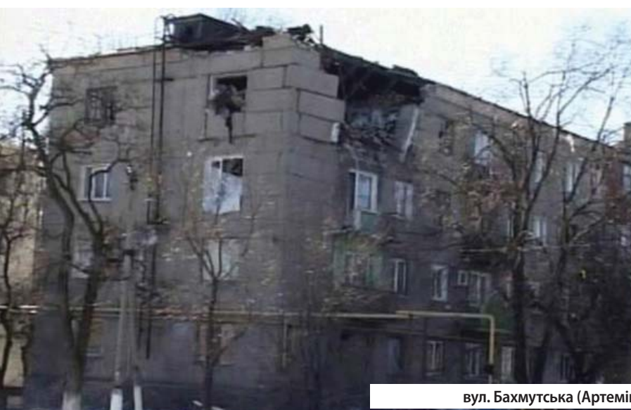
вул. Бахмутська (Артемівська), б. 8