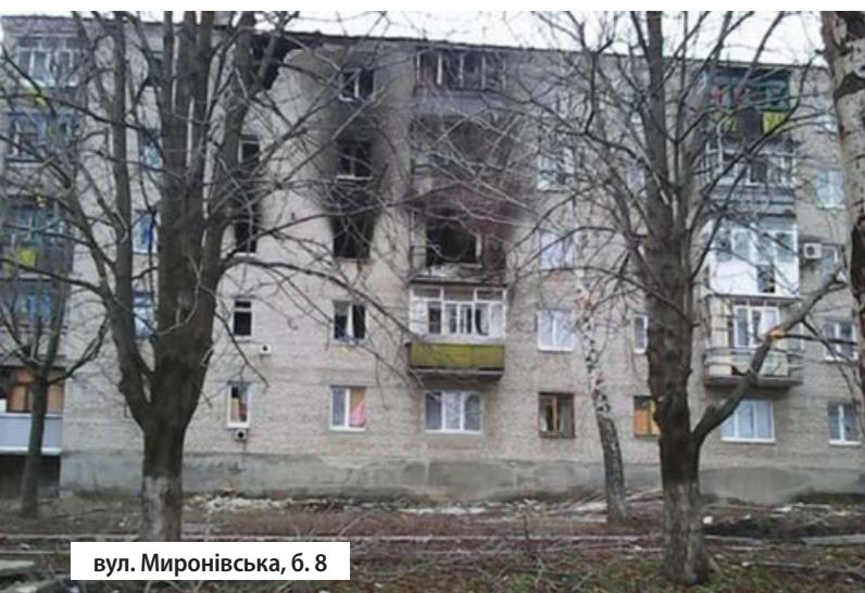
вул. Миронівська, б. 8

До порушень цієї заборони на нашу думку, можуть підпадати систематичні невивіркові обстріли міста Попасна.