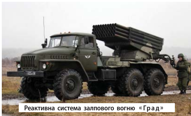
Реактивна система залпового вогню «Град»

У 2014 р. артобстріли здійснювали підрозділи так званої «Армії Юго-Востока»: підрозділ «Призрак», «козачі» війська, підрозділ Дрьомова. Вони обстрілювали місто системами реактивного залпового вогню «Град».