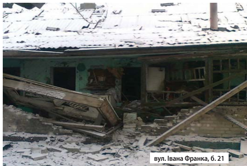
вул. Івана Франка, б. 21

багато мешканців міста ще не були евакуйовані або фізично не мали такої можливості.