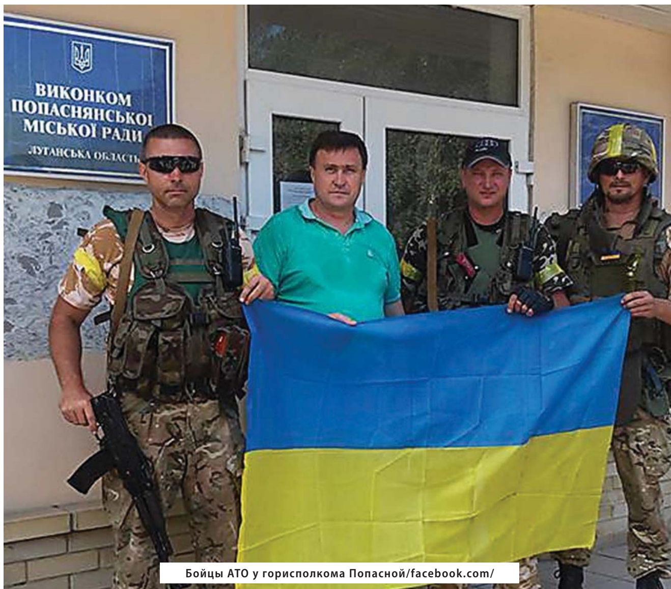
Бойцы АТО у горисполкома Попасной

Спроби представників НЗФ знову захопити Попасну за підтримки російської армії здійснювались упродовж 2014–2018 рр. Адже у разі встановлення контролю над Попасною, терористи можуть взяти у напівкільце стратегічно важливий Світлодарськ, відрізавши його від залізничного сполучення з Україною. 4 Сьогодні Попасна залишається останнім містом на захід від так званої «ЛНР», яке заважає бойовикам розширити свій контроль до адміністративного кордону Луганської області.