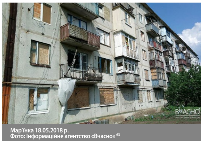
Мар'їнка 18.05.2018 р. 63