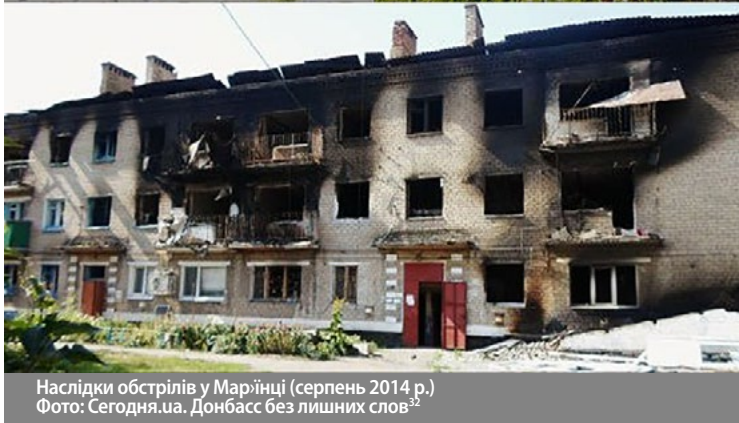
Наслідки обстрілів у Мар'їнці (серпень 2014 р.) Донбасс без лишніх слів 32