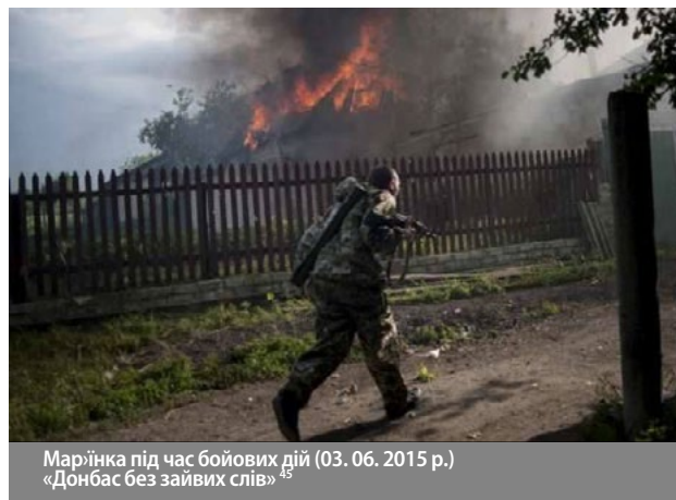
Мар'їнка під час бойових дій (03. 06. 2015 р.) «Донбас без зайвих слів» 45

Бій, що тривав із 3 по 5 червня 2015 р., став однією з найбільших військових операцій, проведених на території Мар'їнки.