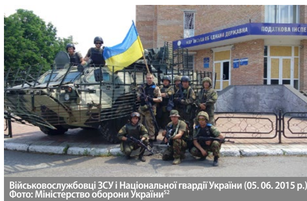
Військовослужбовці ЗСУ і Національної гвардії України (05. 06. 2015 р.) 52