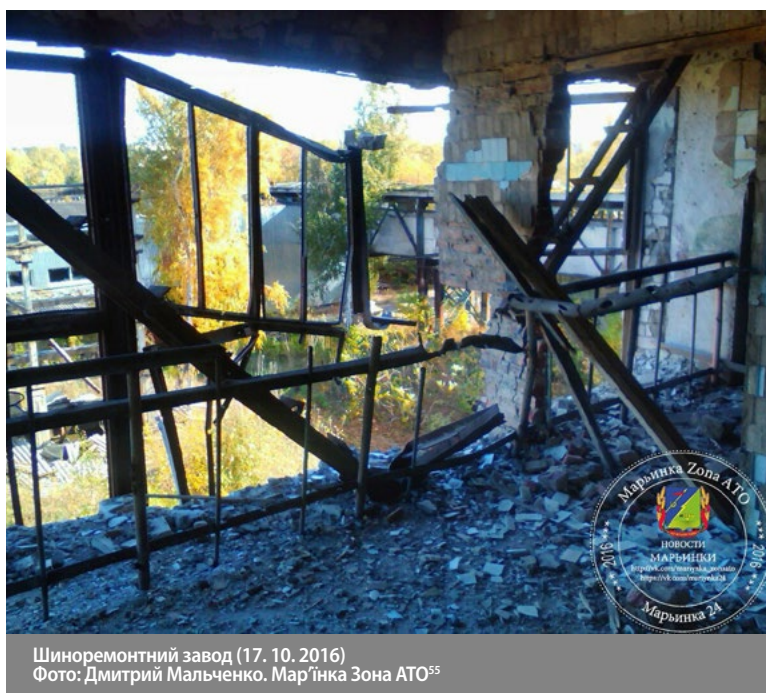
Шиноремонтний завод (17. 10. 2016) Мар'їнка Зона АТО 55