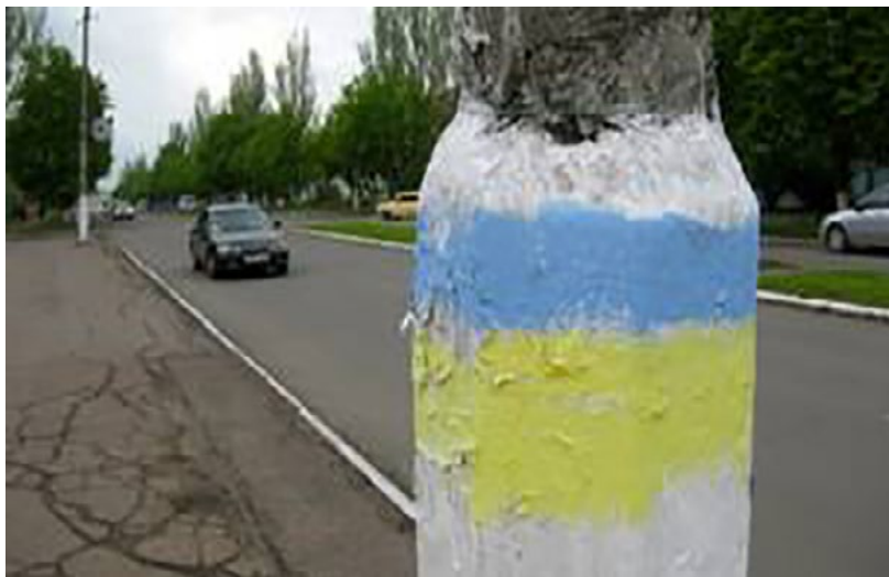
BBC WORLD SERVICE 5

Погляди місцевих мешканців навесні 2014 р. щодо подальшого розвитку подій розділилися: дехто підтримував ідею про автономію, інші – виступали за унітарну державу. Проте більшість прагнула, щоб усе закінчилося мирним шляхом. Такий широкий спектр поглядів перейшов у контroversійні дії: у місті відбувалися мітинги, на яких прихильники самопроголошених республік закликали підтримати референдум, і водночас на стовпах з'являлися намальовані жовто-блакитні смуги.