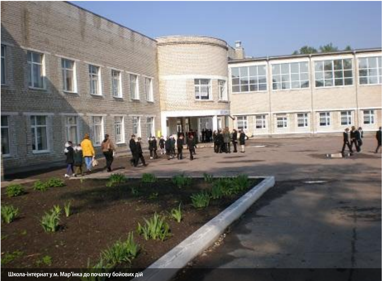
Школа-інтернат у м. Мар'їнка до початку бойових дій

Мар'їнської школи-інтернату було відправлено до Святогірська, в оздоровчий центр «Голубок» 26 .