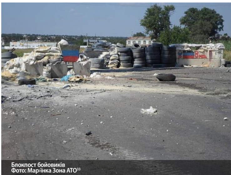
Блокпост бойовиків Фото: Мар'їнка Зона АТО 33