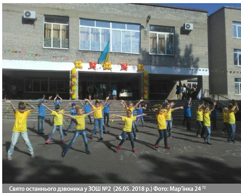
Свято останнього дзвоника у ЗОШ №2 (26.05.2018 р.) 72