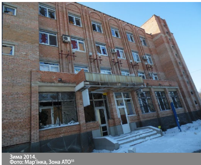
Зима 2014. Фото: Мар'їнка, Зона АТО 55

Незважаючи на такі масштаби руйнувань, мешканці цього незламного міста живуть із надією на відновлення в ньому інфраструктури, адміністративних та приватних будівель. І маючи власний гіркий досвід, бажають миру для всієї України.