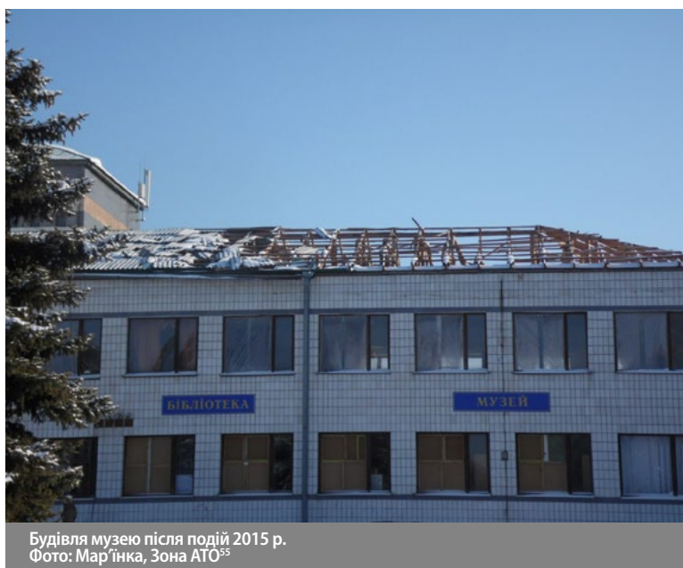
Будівля музею після подій 2015 р. Фото: Мар'їнка, Зона АТО 55

Через постійні обстріли місто спорожніло і перетворилося на примару. Рух з'являється лише зранку, коли стихають звуки пострілів і населення виходить у центр міста на імпровізований ринок. Магазини, аптеки та банки зачинені 57 . Через пошкодження промислових об'єктів люди залишились без роботи. Частина з них працевлаштувалася в сусідніх містечках, проте більшість живе за рахунок пенсій чи інших соціальних виплат.