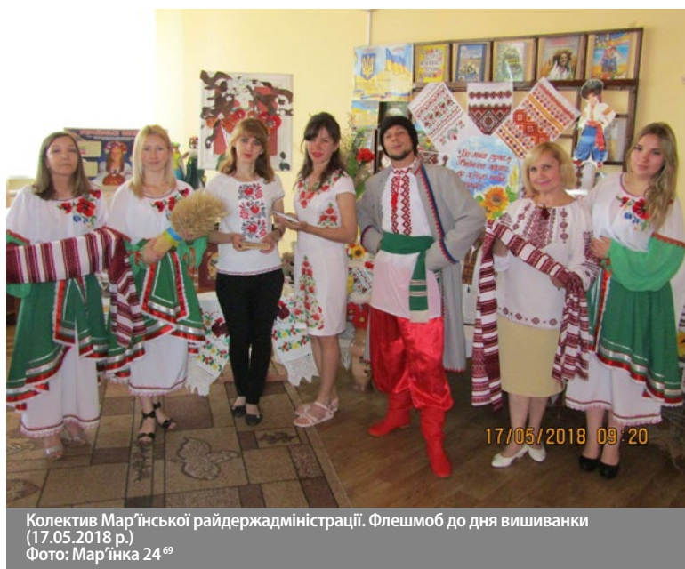
Колектив Мар'їнської райдержадміністрації. Флешмоб до дня вишиванки (17.05.2018 р.) 69

Незважаючи на мирні переговори та угоди, на 4-й рік конфлікту місто досі лишається однією з найгарячіших точок фронту 71 . Війна тут стала звичним явищем.