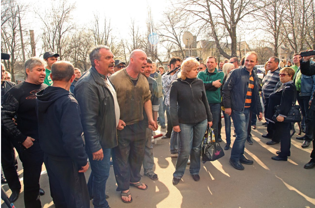
Захоплення МВС Кадіївки (Стаханова).

“...военных видела, но они старались тышком-нышком обходить. Хотя выправка, одежда, экипировка, оружие – видно, что вооружены и одеты идеально (мовою оригіналу, респондент 55330)