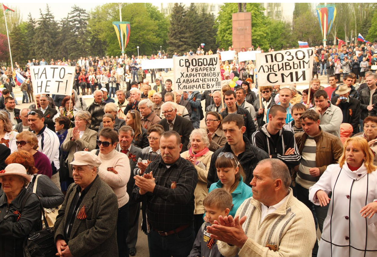
Проросійські мітинги.

“ Сначала никаких политических... никто не выдвигал. Просто какая-то мифическая угроза, начала появляться киевская хунта, это все было связано с событиями на Майдане, я думаю. Когда Янукович бежал из страны, получается, этот вакуум безвластия и началась какая-то непонятная ситуация. И какая-то у них была тревога за будущее, непонятно. Но очень четко муссировалась тема бандеровцев и уже пошли слоганы «киевская хунта»