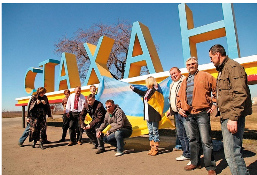
Автопробіги активістів групи «Свідомі українці Стаханова».

“ И там начали мы думать, – что же мы сидим? Нужно что-то делать. И какие-то поступки должны показывать, что мы тут не все серые мыши, что будем молча кивать и возвращать Советский Союз. И приняли решение, тот же Автомайдан. Потом сделали молебен по Небесной сотне... Это было первое наше такое мероприятие. Когда было 40 дней после 20 февраля. И девочки, выпускники делали плакат, портреты сделали. Старались как могли. Чтобы привлечь какое-то внимание к этим событиям