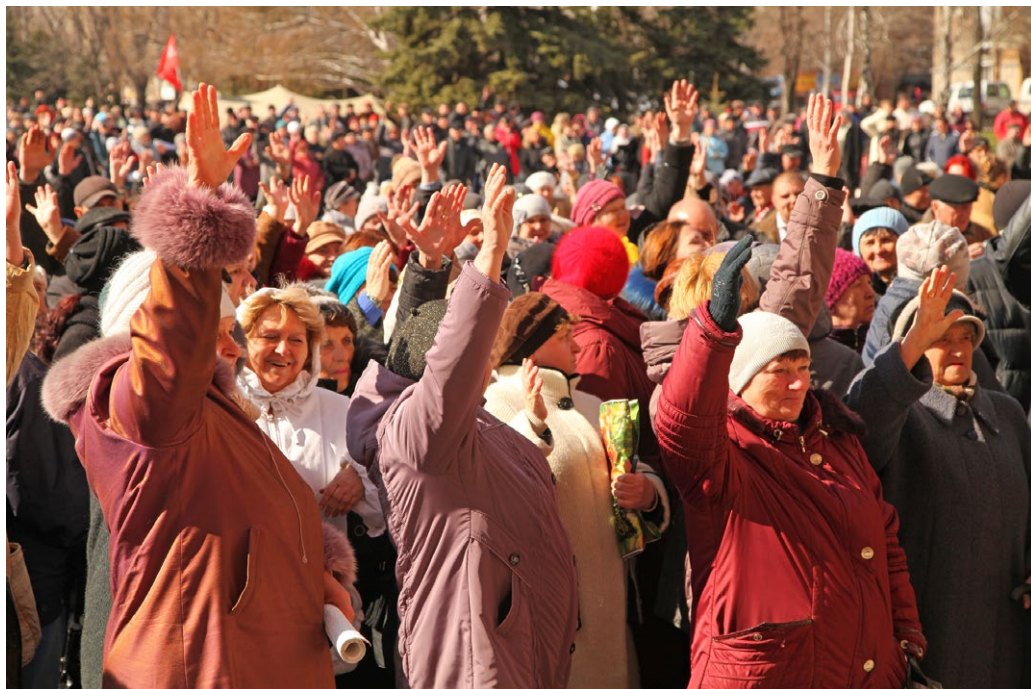
Проросійські мітинги.