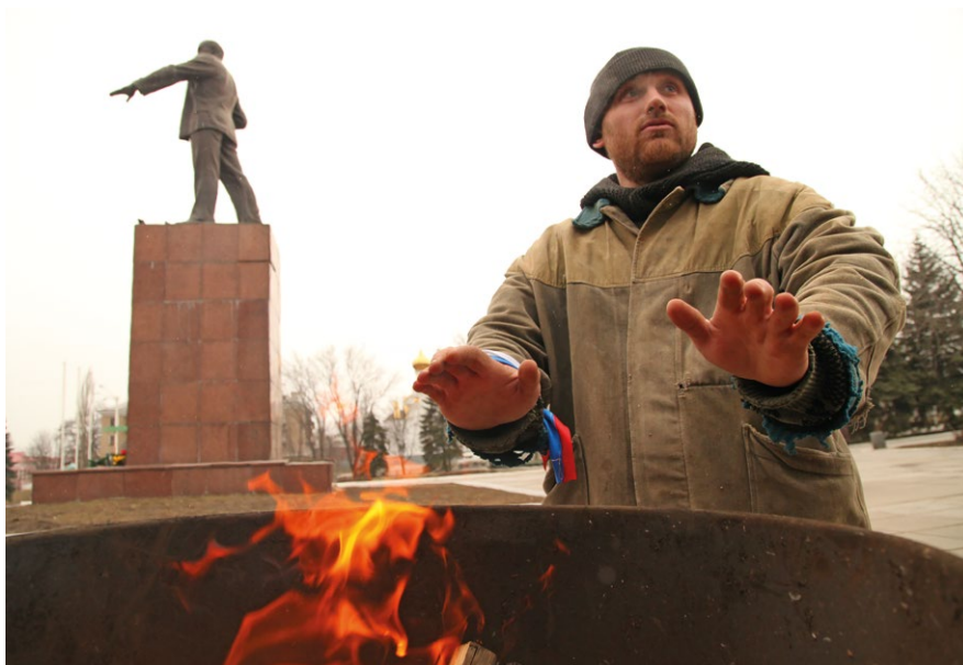
Проросійські мітинги біля пам'ятника Леніну.

“ В тот же период очень сильная пропаганда велась против Украины, против Майдана. И был такой миф, лозунг, что приедут теперь какие-то бандеровцы, которые начнут сносить памятники коммунистическому режиму... В начале, наверное, марта, появились так называемые дружинники, которые установили палатку возле памятника Ленина и начали охранять этот памятник. Это очень странные люди. В основном, какие-то маргиналы, можно сказать, люди без какого-то нормального образования, которые верили этой пропаганде, они начали ночевать в этой палатке, там буржуйки поставили (мовою оригіналу, респондент 55303)