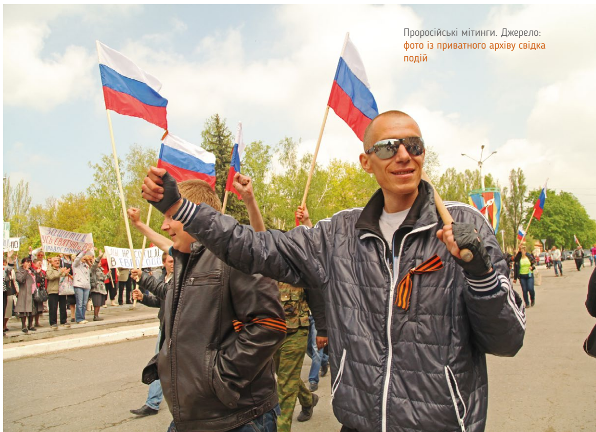
Проросійські мітинги.

есть, они вот так постоянно... на учения возили местных. Людей, которые приезжали из России как наемники, не было смысла их обучать, поэтому отправляли именно местное население (мовою оригіналу, респондент 55316).