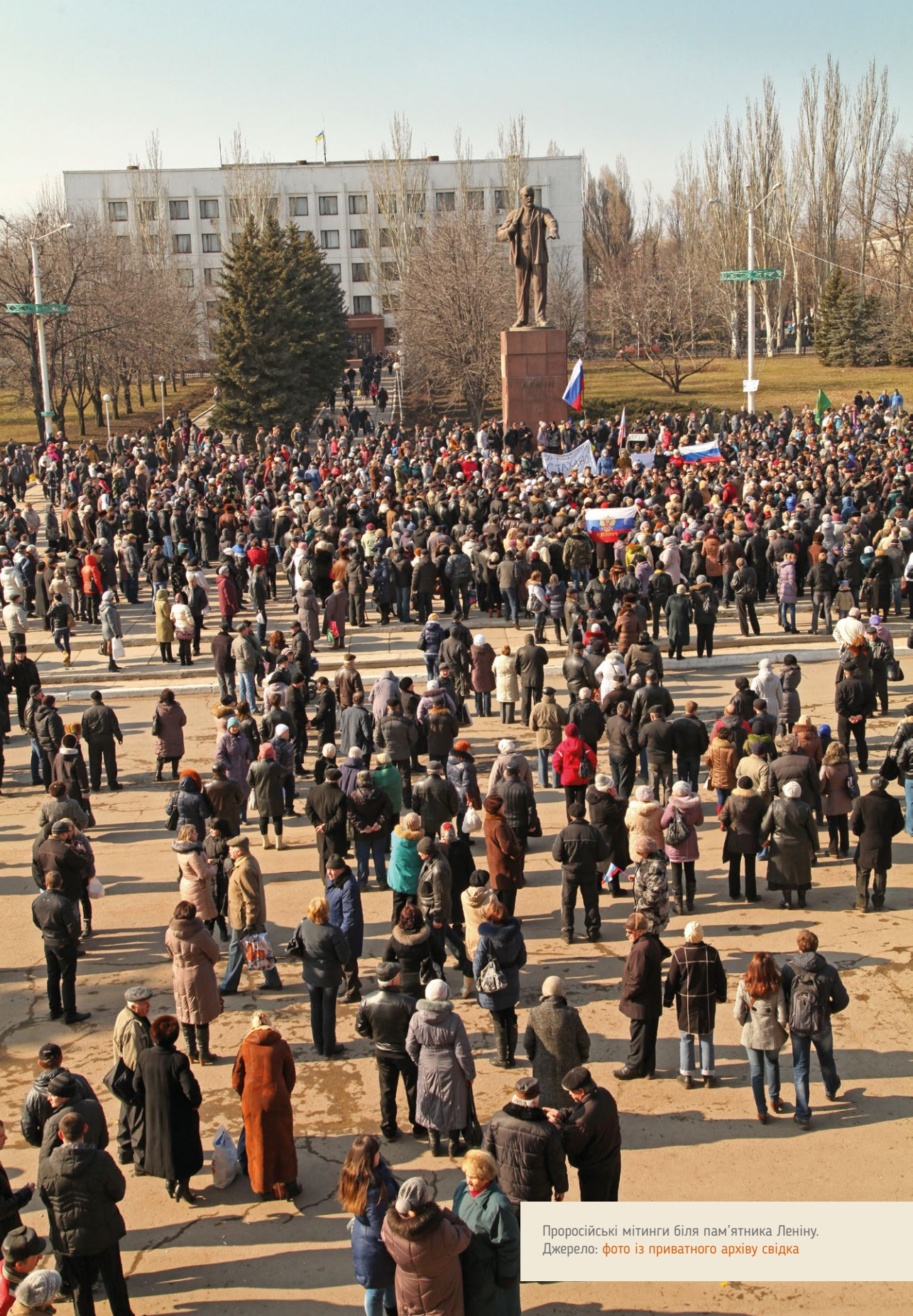
Проросійські мітинги біля пам'ятника Леніну.