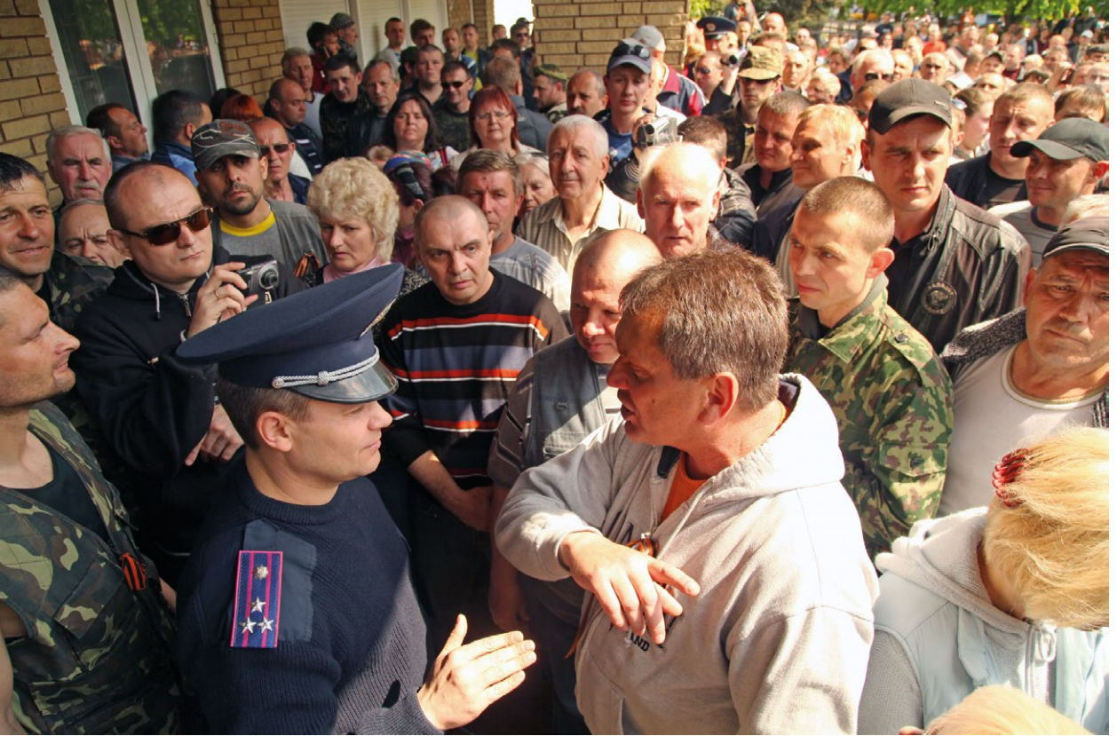
Захоплення МВС Кадіївки (Стаханова).