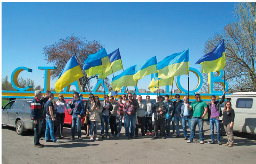
Автопробіги активістів групи «Свідомі українці Стаханова».