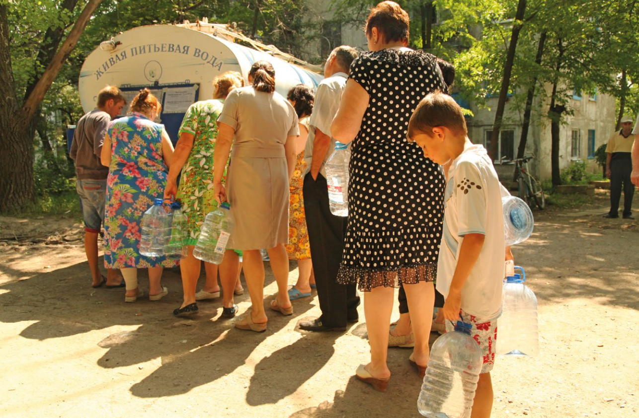
Черга по питну воду в місті Кадіївка.

“ ...Было начало августа – конец июля. Мы были на даче, не было уже в Стаханове воды. Гуманитарная очень плохая была ситуация, реально коллапс. Воды не было, были перебои, продукты питания люди гребли тележками, кто что мог урвать, потому что в магазинах начиналось такое, не больше 5 штук в руки и так далее