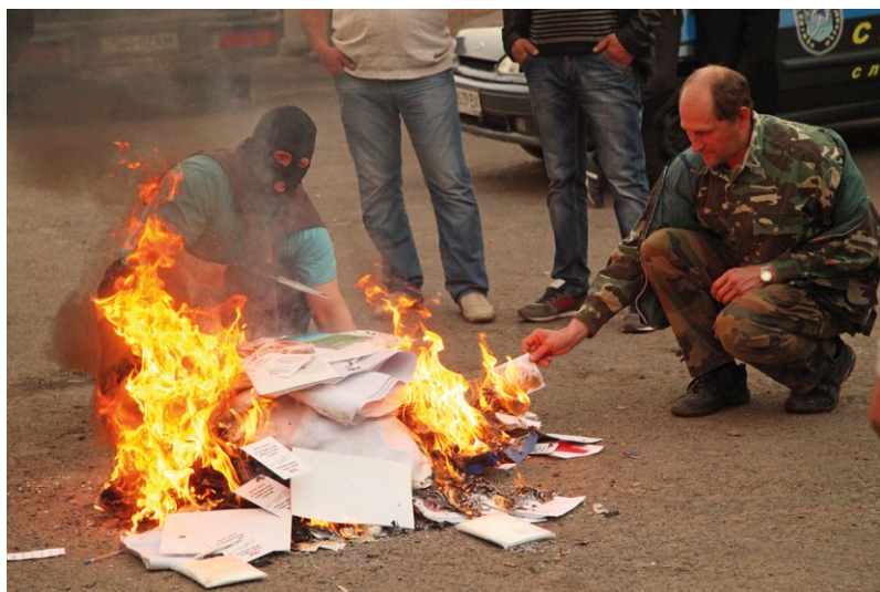
Погроми в офісах політичних партій. Офіс «Батьківщини».

потом как-то эта палатка сгорела. Они каждые 3 дня устраивали там митинг, причем очень часто эти митинги противоречили друг другу по смыслу и содержанию. И это все выглядело как шоу бесконечное, в котором было ощущение, что когда все придет в законное русло, то эти все люди просто разойдутся по домам. Они очень сильно раскачивали