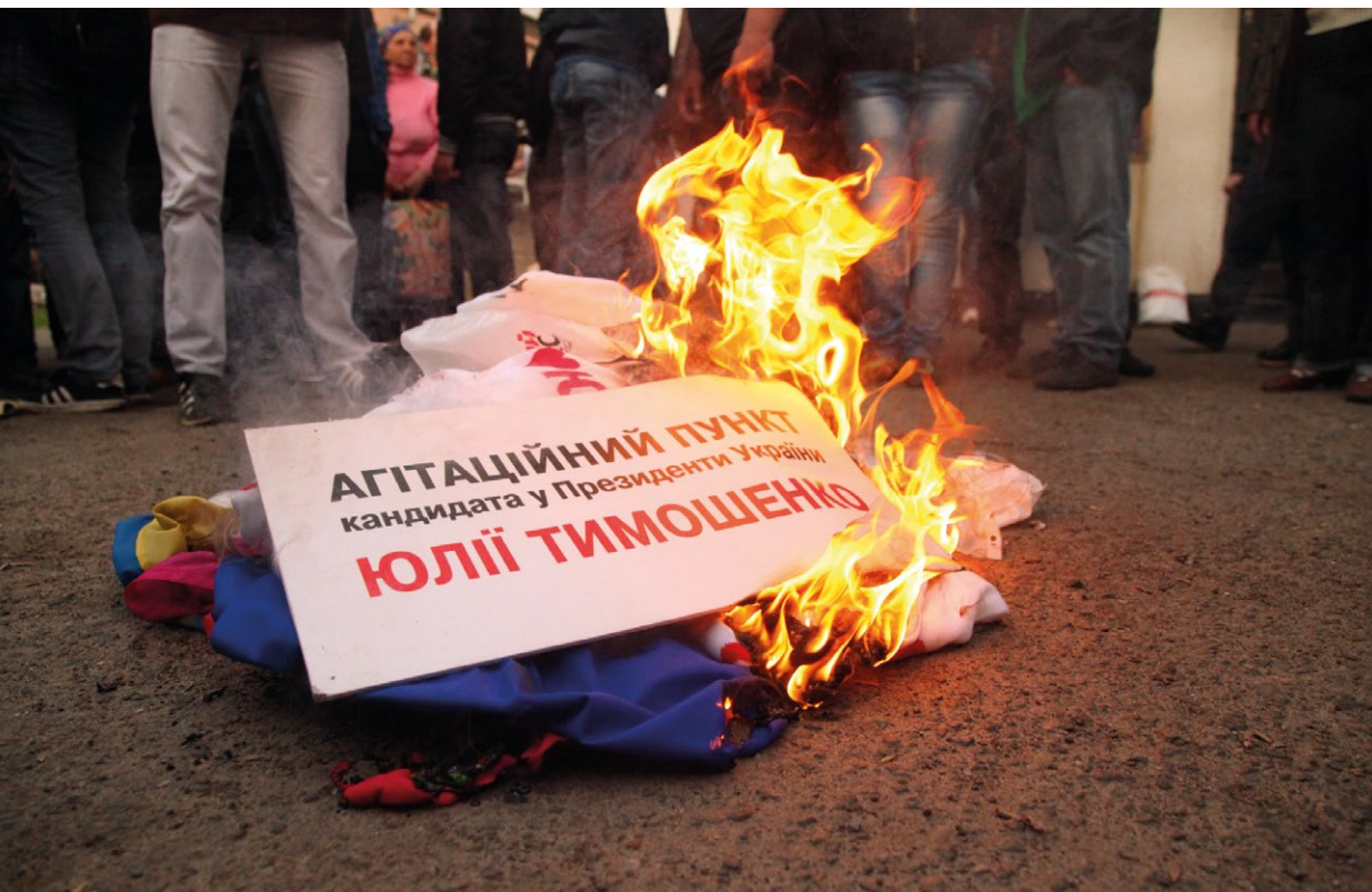
Проросійські мітинги біля пам'ятника Леніну.

Они показывают: нет у них оружия, нет. «Все, уходим». Люди, вот эта зверская толпа сбивает гербы, которые были на воротах СБУ. Понятное дело, что срывают государственную символику (мовою оригіналу, респондент 55303)