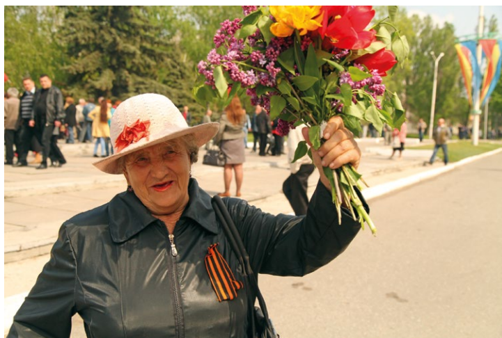
Проросійські мітинги. Джерело: фото із приватного архіву свідка подій

“ 2014 год для нас начался тревожно, потому что были уже события, Майдан, Киев. Но у нас все было абсолютно тихо, вплоть до того момента, когда в Харькове в феврале снесли памятник Ленину. Вот тогда у нас появились первые палатки... Сначала пикет прошел, митинг какой-то, потом стояла просто военная палатка. В этой палатке сидели люди, частично это были стахановчане, а частично туда приезжали... не знаю, кто это был, но явно неместные. Мы потом уже поняли, что эта палатка была как центр координации действий (мовою оригіналу, респондент 55317).