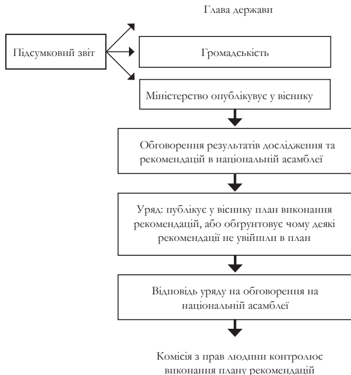
Таблиця 2: Представлення підсумкового звіту

Представлення підсумкового звіту може бути дуже емоційною та історичною подією. У Гватемалі звіт був представлений керівникам уряду та громадянського суспільства в Національному театрі. Вперше в історії Гватемали офіційний орган визнав, що геноцидні дії були вчинені проти корінних народів.