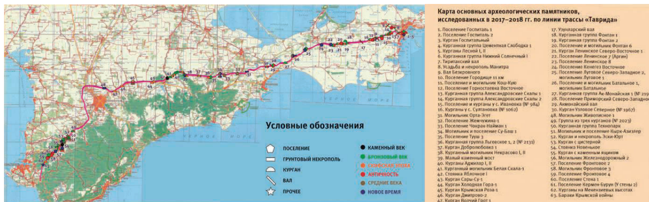
Карта основных археологических памятников Украины, разрушенных во время строительства «трассы Таврида» в 2017-2018 годах (по информации Института археологии Российской академии наук)

Непосредственно незаконные археологические раскопки производились на площади более 90 га. Их результатом стало уничтожение более 90 археологических памятников различных эпох 215 . Описание объектов, места их расположения представлены на карте 216 .