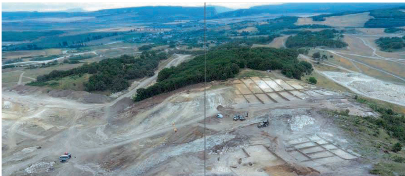
Виды на раскопки поселения Кермен-Бурун, середины II - 1-й половины III в. н. е., обнаруженного возле с. Фронтное (г. Севастополь) на левом берегу р. Бельбек в ноябре 2016 года во время «плановой разведки» мест прокладки трассы «Таврида»

Непосредственно незаконные археологические раскопки производились на площади более 90 га. Их результатом стало уничтожение более 90 археологических памятников различных эпох 215 . Описание объектов, места их расположения представлены на карте 216 .