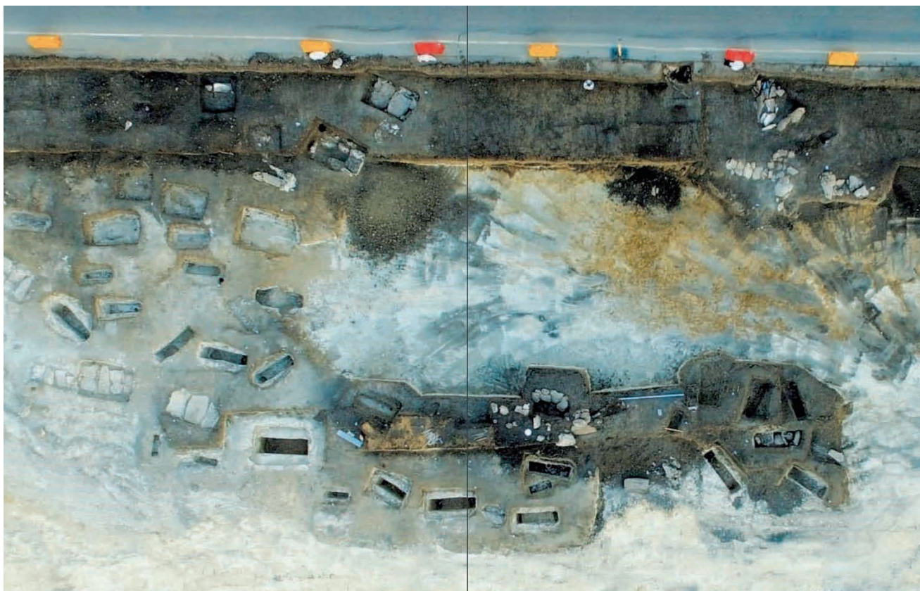
«Исследования» могильника римского периода Александровской Скалы 1, расположенного в 10 км северо-западнее города Керчь

Во время незаконных раскопок были выявлены сооружения, предназначенные для жилища и производственные комплексы. Раскопки проводились и на территориях отдельных захоронений и погребальных комплексов 217 .