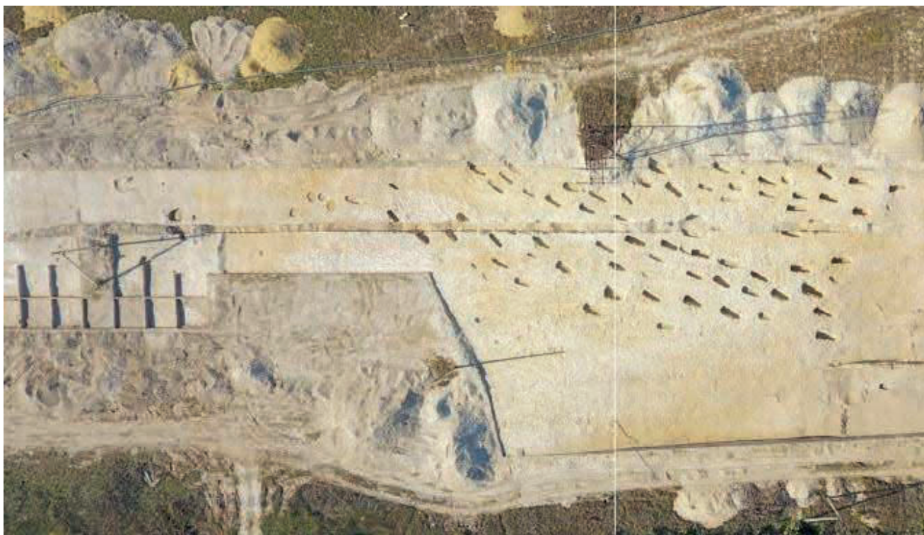
Могильник и поселение Кырк-Азизлер. Фото с квадрокоптера, сделанное группой российских археологов

Раскопки проводились поспешно, лицами, которые не имели достаточного опыта работы с крымским материалом, в крайне ограниченные сроки, которые по словам украинских экспертов, не позволяют надлежащим образом изучить исследуемый объект. Атрибуция артефактов осуществлялась вразрез с общепринятыми в научной среде правилами 219 .