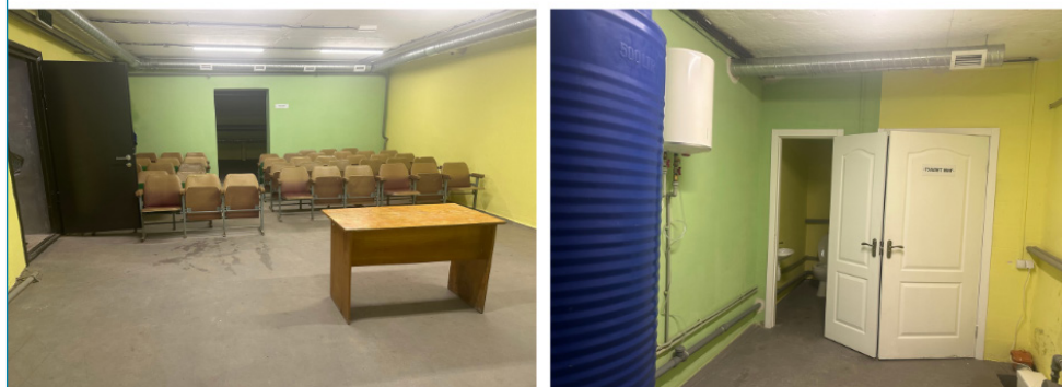
Фото ГП УГСПЛ в м. Суми